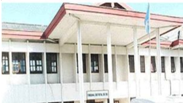
TRIBUNÁL DISTRITAL SUAI

Iha 08 Abril 2014, rezidencia juís/autór judisiáriu Tribunál Distrital Suai hetan asaltu husi ema diskoñesidu balun ne'ebé diskonfia involve iha prosesu balun ne'ebé sei lao hela iha Tribunál Distritál Suai.