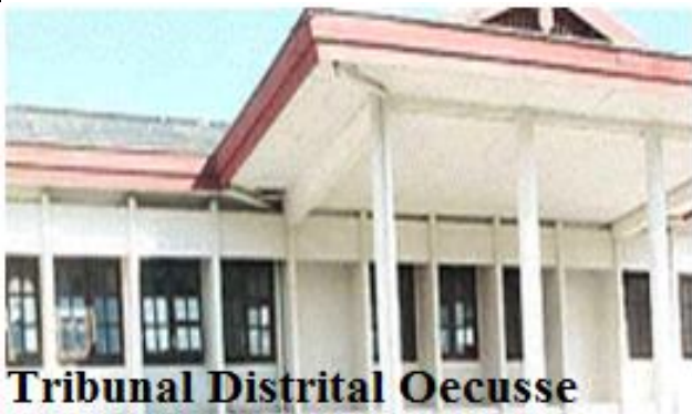
Tribunal Distrital Oecusse

Iha fulan Maiu 2014, JSMP continua hala'o atividade monitorizasaun iha Tribunál Distritál Oe-Cusse. Iha períódu fulan Maiu ne'e, JSMP consege monitoriza kazu hamutuk 7 husi total kazu 21 ne'ebé Tribunál Distritál Oe-Cusse julga.