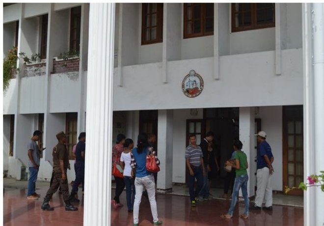
Tribunal Distrital Dili

Iha 29 Maiu 2015, Tribunál Distritál Dili prejide leitura sentensa ba krime violénsia doméstika ne'ebé involve arguidu JdC tanba komete krime ba dala rua hasoru nia feen, iha Distritu Ermera.