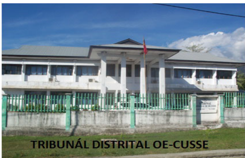
TRIBUNÁL DISTRITAL OE-CUSSE

Iha 18 Juñu 2015, Tribunal Distrital Oe-Cusse kondena arguidu FM ho pena prizaun tinan 1 fulan 6 suspende ba tinan 2 fulan 6 tanba arguidu konfesa no rekoñese katak nia komete duni krime hasoru nia feen, iha 18 Outubru 2014 no iha 05 Novembru 2014, iha Distritu Oe-Cusse.