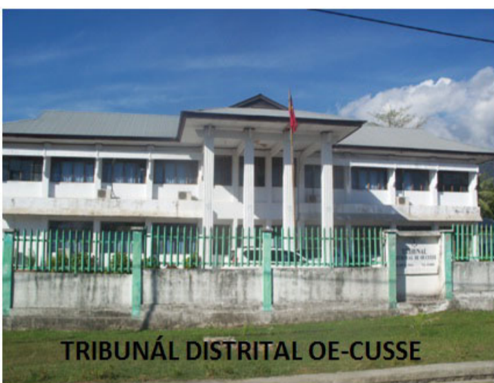
TRIBUNAL DISTRIITAL OE-CUSSE

Iha 07-10 Abril 2015, Tribunál Distritál Oe-Cusse laiha oráriu audiénsia julgamentu tanba tribunál halo hela preparasaun ba julgamentu kazu kolektivu sira ne'ebé planeadu sei hala'o iha semana oin hahu hosi 13-17 Abril 2015.