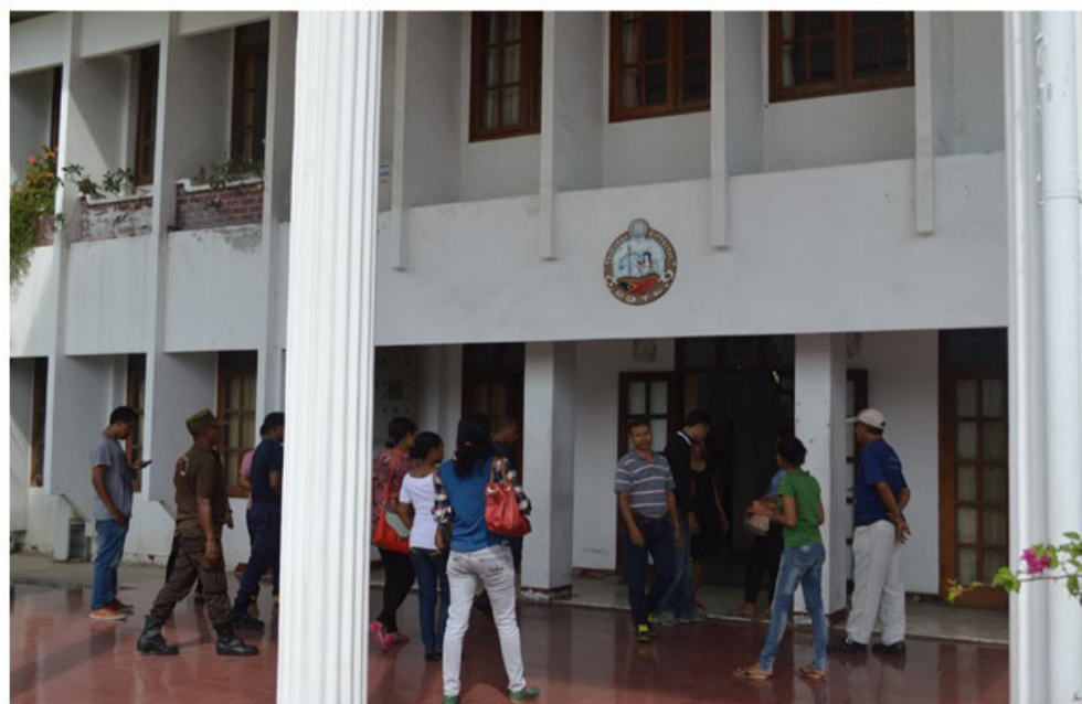
Tribunal Distrital Dili

Iha 09 Abril 2015, Tribunál Distritál Dili prezide julgamentu hodi anunsia adiamentu ba kazu furtu agravadu ida ne'ebé akontese iha Distritu Dili.