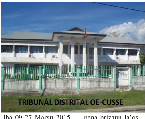
TRIBUNÁL DISTRIITAL OE-CUSSE

Iha 09-27 Marsu 2015, Tribunál Distritál Oe-Cusse julga kazu ofensa ba integridade fízika simples ho natureza violénsia doméstika 6 hosi total kazu 11 ne'ebé mak JSMP observa iha tribunál ne'e no maioria tribunál konklui ho suspensaun ba pena prizaun.