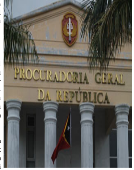
kuandu iha rekizitu hotu-hotu kona-ba lejítimidade.

JSMP mós hanoin katak embora Tribunál Rekursu iha pozisaun