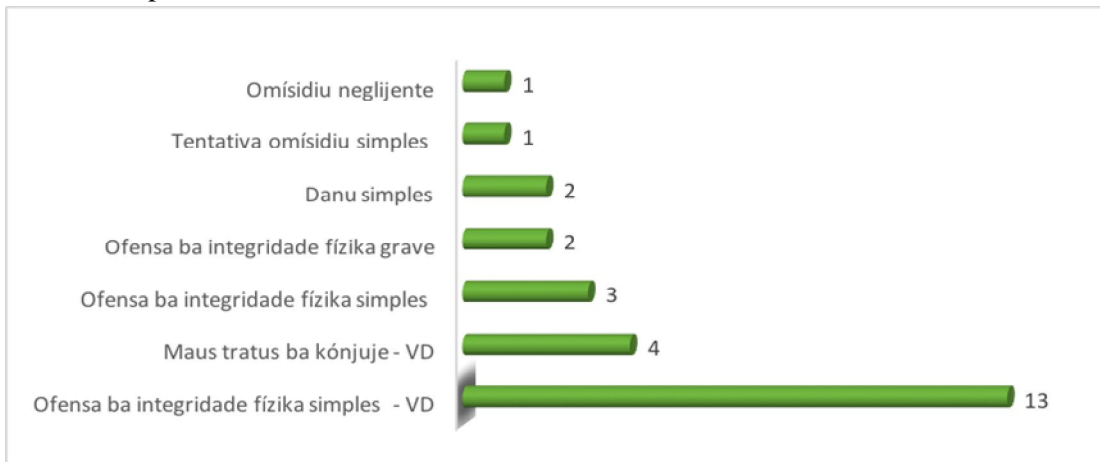
Grafiku : Tipu kazu sira ne'ebé antes ne'e rezolve iha comunidade