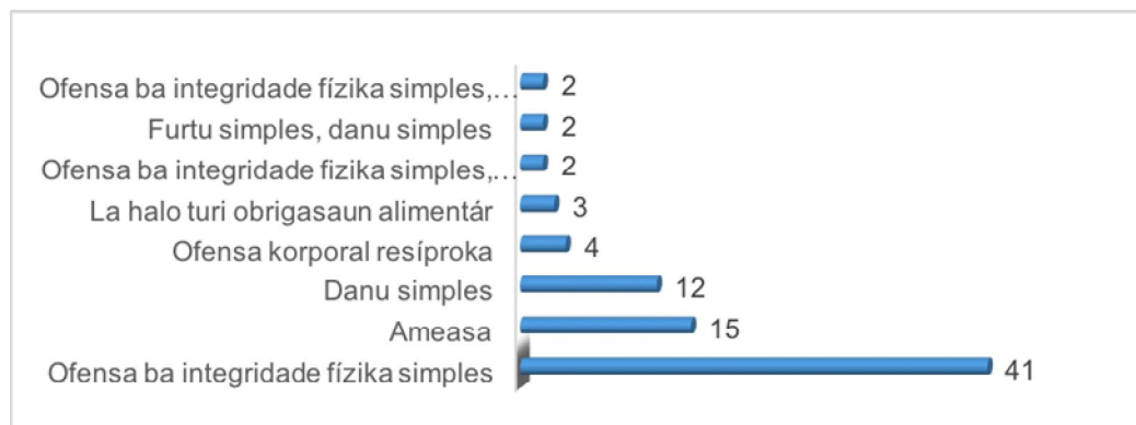
Grafiku II : Kazu sira ne'ebe Tribunál halo tentativa konsiliaun :